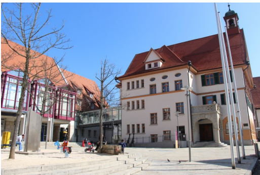
Neues und Altes Rathaus in Metzingen

Die Stadt Metzingen als Arbeitgeber zeichnet sich u.a. durch ein modernes und ausgeprägtes Gesundheitsmanagement und durch seine Zertifizierung als familienfreundlicher Arbeitgeber aus.